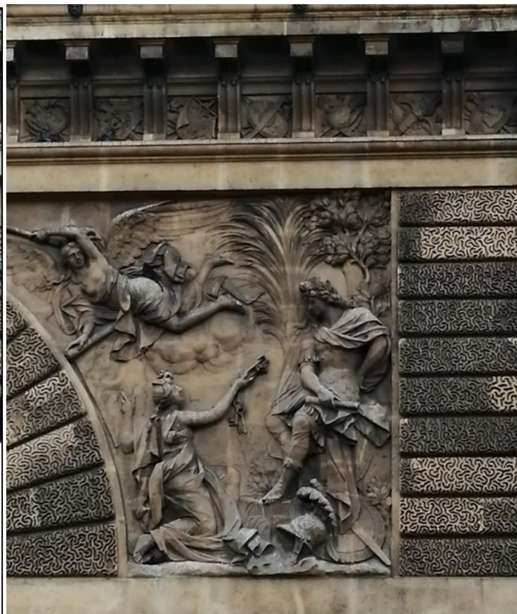
La Porte Saint-Martin, façade extérieure (1674) et façade intérieure.