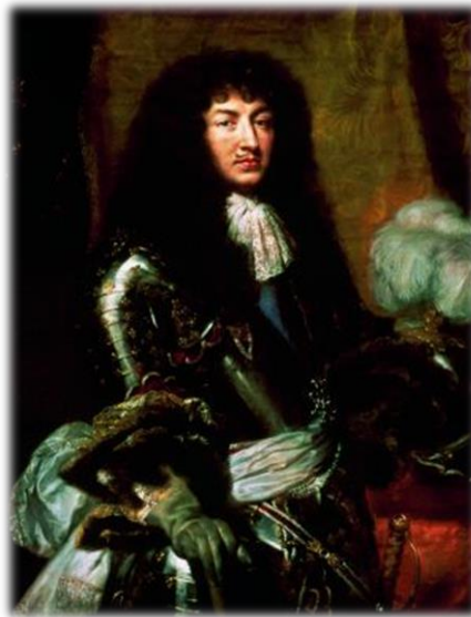
Louis XIV en 1670 (32 ans)