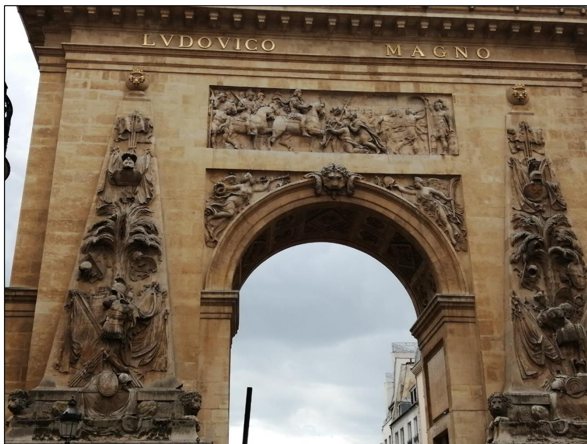
La Porte Saint-Denis, à Paris (1672 : victoires sur le Rhin et en Franche-Comté).