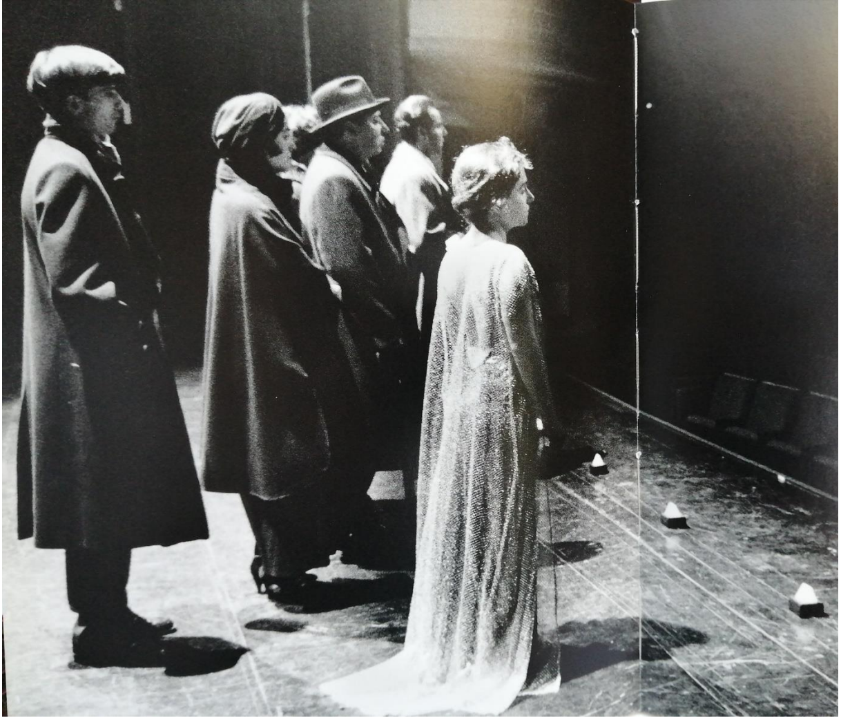
Les Solitaires intempestifs.