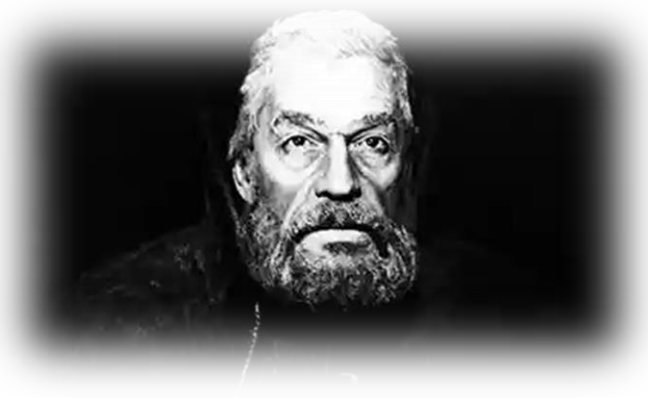
Paul Scofield, un Lear historique, dans la mise en scène de Peter Brook pour la Royal Shakespeare Company, 1962.

Giorgio Strehler, Un Théâtre pour la vie , Feltrinelli 1974, Paris, Fayard, 1980, p. 278-297, extraits.